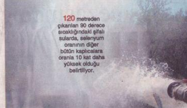
120 metreden çıkarılan 90 derece sıcaklığındaki gıfali sularla, selenyum oranının diğer bütün kaplıcalara oranla 10 kat daha yüksek olduğu belirtiliyor.

Dikili'yi dünyanın tanıdığı ancak Türkiye'nin hala keşfedemediğini söyleyen Uğur, "Bugün Avrupa'nın en büyük limanı Dikili'ye bağlı Çandarlı'da yapıyor. Yine uluslararası bir hava limanı Çandar-