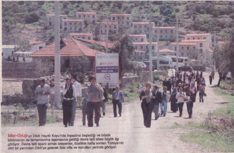
Mer-Grup'un Dikili Hayatlı Koyu'nda inşaatına başladığı ve büyük bölümünün de tamamlanma aşamasına geldiği devre tatil sitesi büyük ilgi görüyor. Devre tatil apartı almak isteyenler, özellikle hafta sonları Türkiye'nin dört bir yanından Dikili'ye gelecek lüks villa ve konutları yerinde görüyor.